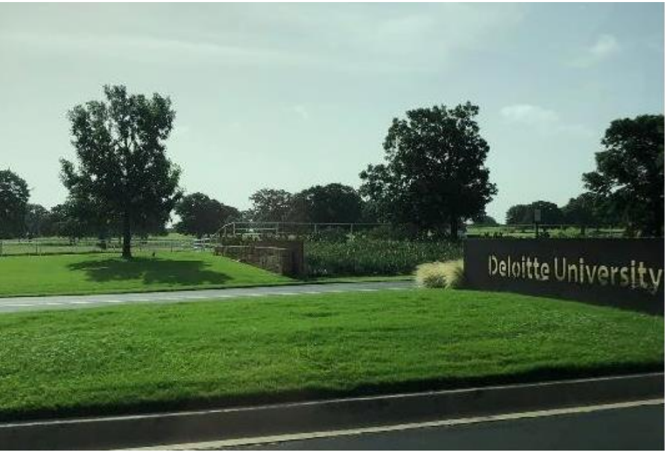
圖 2 乘車進入 Deloitte University 窗外景像