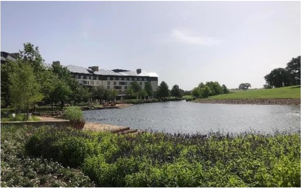
圖 3 Deloitte University 湖畔景像

每年美國會計學會 (The American Accounting Association) 舉辦的博士生論壇(Doctoral Consortium)，除了會邀請近 100 位全球會計博士生至 Deloitte University 進行學術交流外，還會安排博士生與數位會計界頂尖學者進行晤談、討論及諮詢，行程滿檔，內容充實，很榮幸今年我是那百分之一。AAA 博士生論壇的主要目標，係通過透豐富並加強博士生的教學及研究經驗，以提高博士生於未來投入會計教育界的教學品質，及從事學術工作的研究品質。