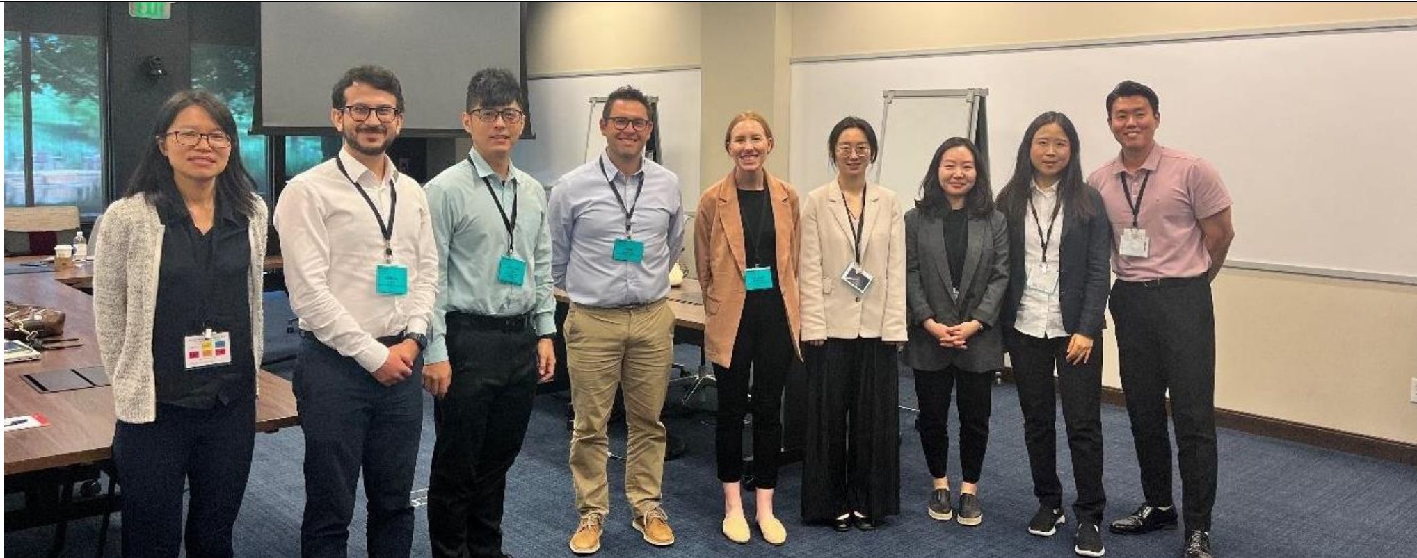
圖 4 博士生團照